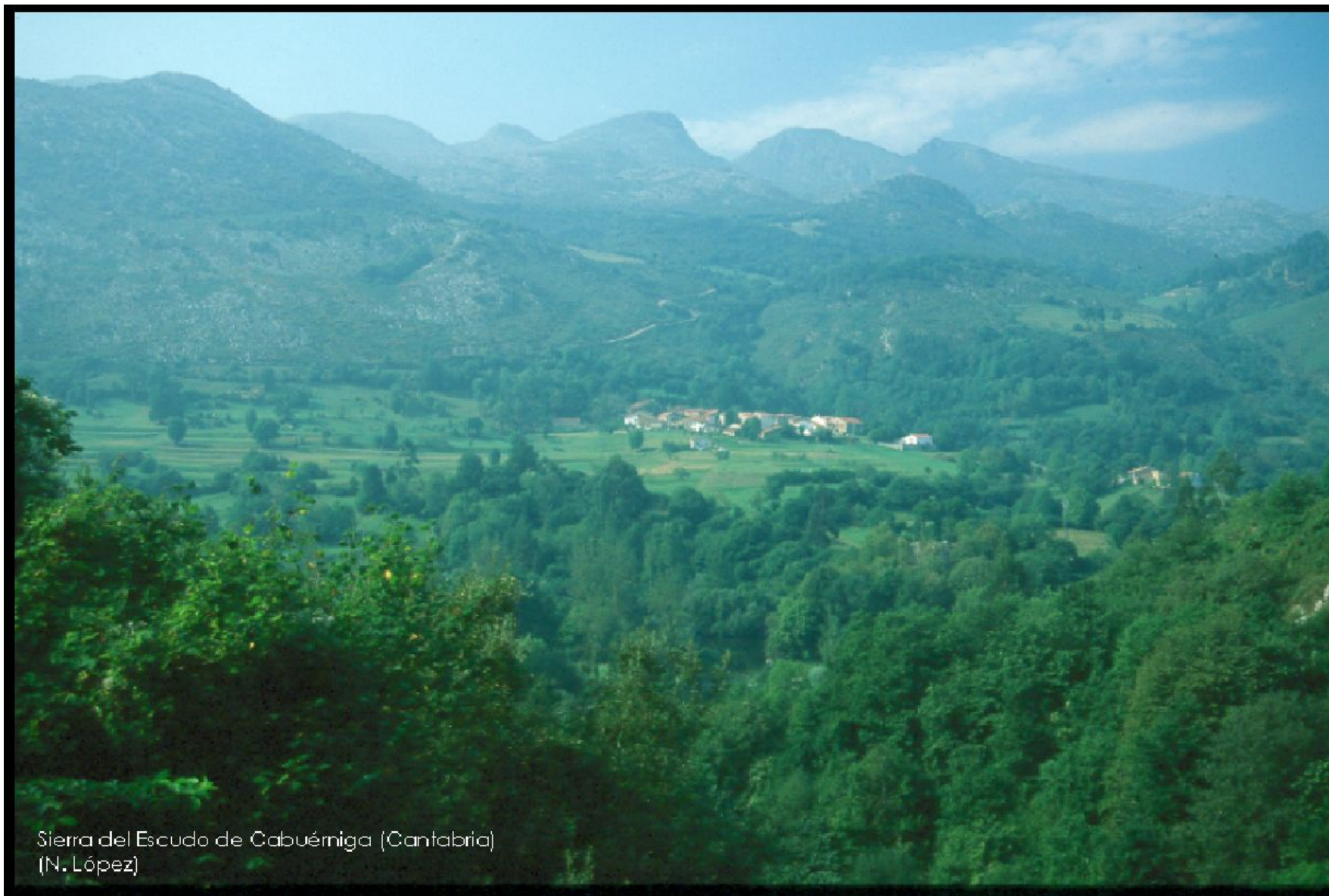
Sierra del Escudo de Cabuérniga (Cantabria) (N. López)